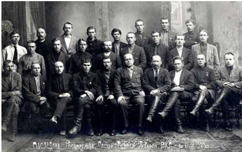
Последний расширенный Пленум Пермского Губкома РКП(б) 16–17 сентября 1923 года