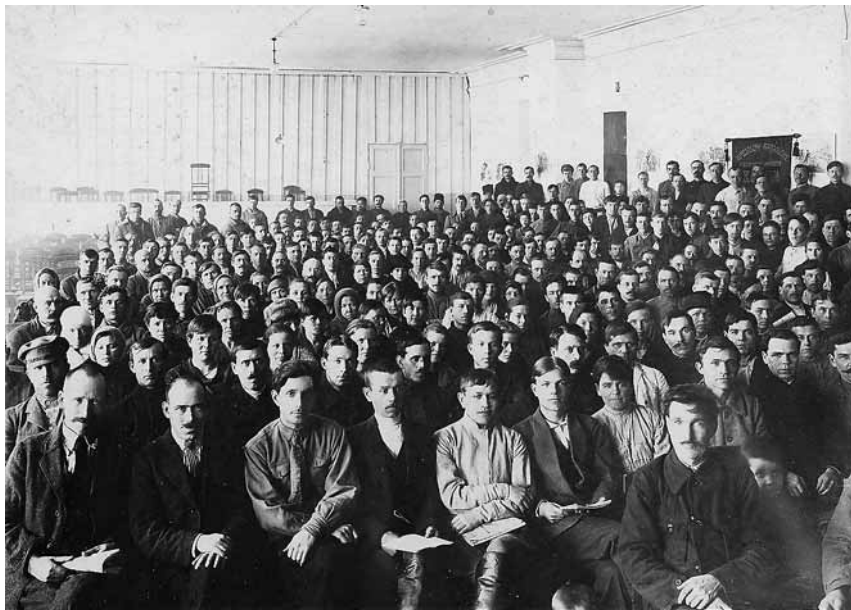
Мотовилихинская организация РКП(б) Январь 1924 года

на, она вполне законна, и служит показанием критического отношения рабочих к строительству, тем паче, что разъяснение парторганов считается теперь как самое авторитетное, и они всегда соглашаются, злой демагогии и обывательского нытья среди рабочих стало совсем мало, а растет сознательное критическое отношение, с целью лишь подтолкнуть ту или иную организацию» 323 . В отчете не приведено конкретных примеров как «приятной» и «законной» «оппозиции», так и «злой демагогии и обывательского нытья», но напрашивается вывод, что для партфункционера важнее то, что рабочие «всегда соглашаются» с «авторитетными разъяснениями парторганов».