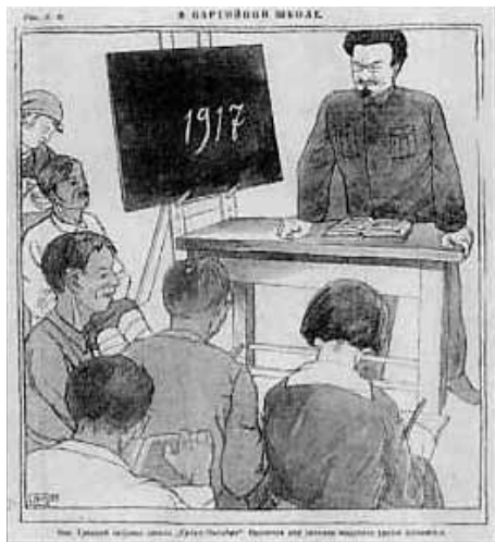
«В партийной школе». «Тов. Троцкий задумал давать «Уроки Октября». Придется ему сначала подучить уроки Ленинизма». («Крокодил», 1925. № 1)

с Каменевым: «Если оценить дискуссию, то по целому ряду вопросов я оказался прав... Но теперь я буквально боюсь высказать свое мнение... Вы относитесь ко мне как к заведомому еретикам» 290 .