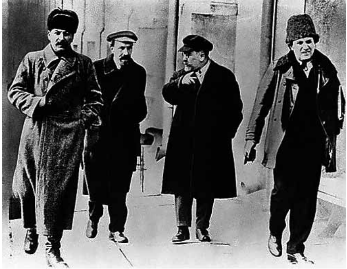
Сталин, Рыков, Каменев, Зиновьев в 1924

15 декабря в «Правде» публикуется статья Сталина «О дискуссии, о Рафаиле, о статье Преображенского и Сапронова и о письме Троцкого». В ней Сталин, по сути, совершил подлог, назвав оппозицию блоком «части “левых” коммунистов (Преображенский, Стуков, Пятаков и пр.) с так называемыми демократическими централистами (Рафаил, Сапронов и пр.)», а Рафаила назвал «самым последовательным и законченным представителем нынешней оппозиции». Сталин указал на «беспорядочное отступление оппозиции», представив ход дискуссии таким образом, что за оппозицией нет реальной поддержки, а ее лидеры неизбежно скатываются до поддержки критикуемого ЦК. Преображенский косвенно был обвинен в ревизии и отступлении от ленинизма. Больше всего досталось Троцкому, рассуждения которого о возможности перерождения «старой гвардии» генеральный секретарь перевел с защищаемого им аппарата на «ряд элементов, могущих породить действительную опасность перерождения некоторых рядов нашей партии. Я имею в виду одну часть меньшевиков, вошедших в нашу партию поневоле и не изживших еще старых оппортунистических навыков» 119 . Своей статьей генсек спровоцировал появление особого типа «оппозиционных» резолюций — «в защиту Троцкого».