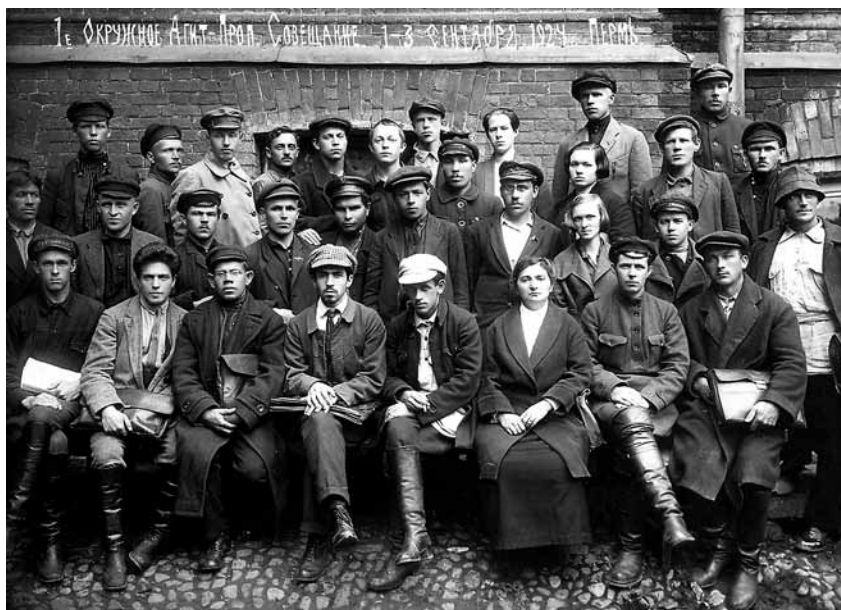
3-я окружная конференция РКП(б). 28–30 ноября 1924 года 1-е окружное агитпроп совещание. 1–3 сентября 1924