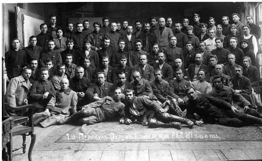
Первая Пермская Окружная конференция РКП(б) 11–13 ноября 1923 года